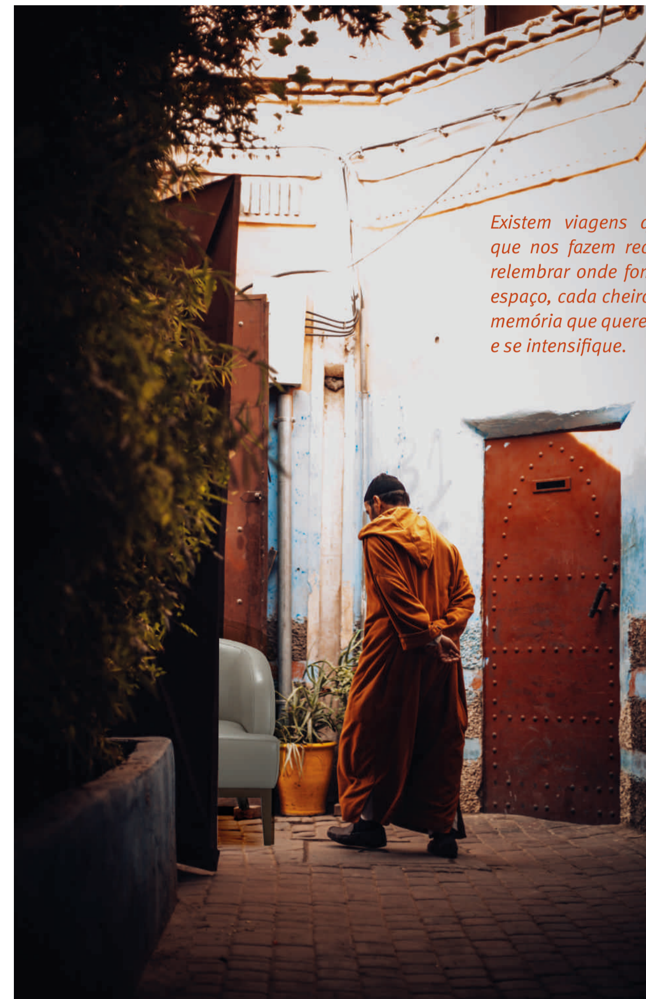
Existem viagens que recordamos, que nos fazem recuar no tempo e relembrar onde fomos felizes. Cada espaço, cada cheiro representa uma memória que queremos que persista e se intensifique.