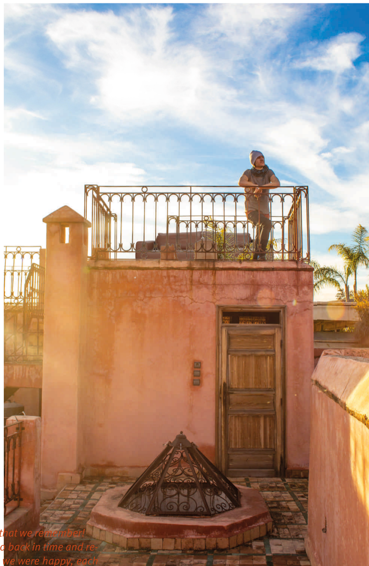
There are trips that we remember! That make us go back in time and re- member where we were happy, each space, each smell represents a me- mory that we want to persist and in- tensify.